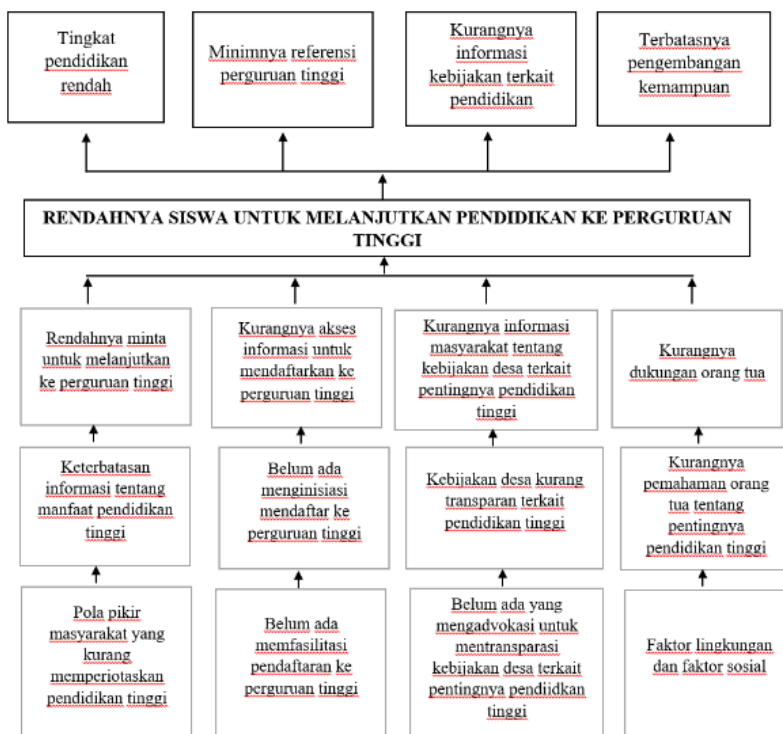
Gambar 4. 1 Pohon Masalah Kurangnya Minat Melanjutkan Ke Perguruan Tinggi